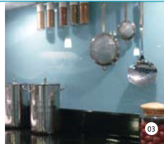
03. | 04. Nicht nur im Bad: vetroComfort ist kombinierbar mit vielen weiteren Funktionen und Designs. Es überzeugt auch bei seinem Einsatz in der Küche als Arbeitsplatte oder Rückwand.