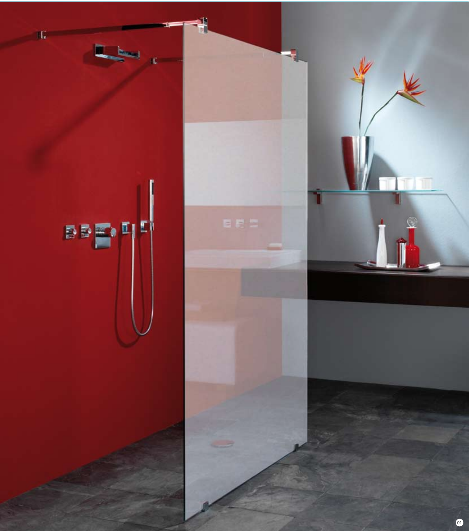
01. Glänzender Schimmer: Das Duschenglas vetroComfort gibt es auch in den Ausführungen satiniert und sandgestrahlt.