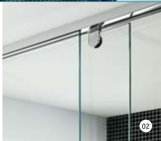
01. | 02. Vielseitig: Wie alle anderen Gläser für Bäder und Duschen aus unserem RaumGlas Programm lässt sich auch vetroComfort mit vielen Beschlägen kombinieren.

Veredelung ohne Nanotechnik: Bei der Herstellung von vetroComfort kommen keine künstlichen Nanopartikel zum Einsatz. Die hohe Haftung der hydrophilen Oberfläche basiert – neben dem Einbrennen im Vorspannofen – ausschließlich auf einer Silicium-Verbindung.